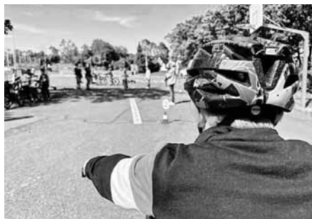
Gleich geht's über los die schmale Rampe ...

„Am letzten Samstag bei bestem Wetter haben sich die Viertklässler auf dem Pausenhof der Teckschule Dettingen getroffen. Alle vierten Klassen werden in den nächsten Wochen ihre Fahrradprüfung machen. Um zu üben, haben wir am ADAC Fahrradtraining teilgenommen.“