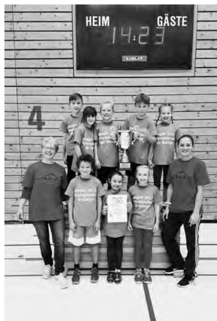
Sieger mit Pokal